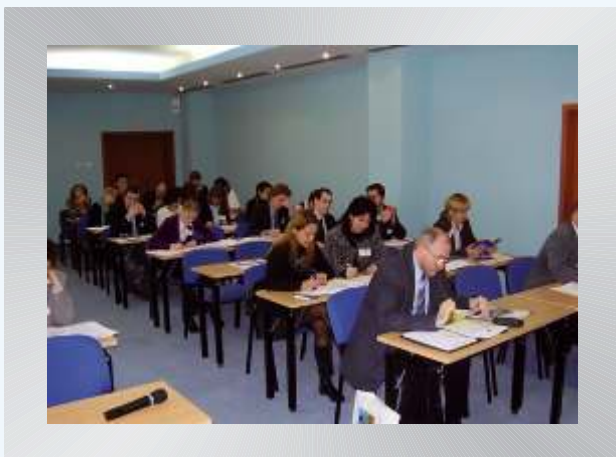
4-ти методологичен семинар организиран от Комитета на мрежата на иновативните региони в Европа.

На 6 и 7 декември в гр. Синая, Румъния се проведе четвъртият Методологичен семинар по иновации, организиран от Комитета на мрежата на иновативните региони в Европа. На семинара присъстваха 50 участници от 13 страни. Представени бяха успехите на региони разработили и изпълнили регионални иновационни стратегии.